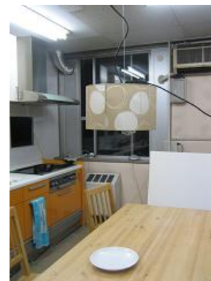
図 4: “いろどりん”システムの概観

本システムは C++ 言語を用いて実装し，画像処理には OpenCV ライブラリを用いた．システムには WEB カメラ ( Logitech V-UJ16 )，Windows PC ( Centrino Duo 1.5GHz, RAM 1.5MB )，プロジェクタ ( 東芝製の小型の LED プロジェクタ TDP-FF1A ) を使用した．いろどりんシステムを使用した例を図 3 に示す．いろどりんシステムを使用する前の皿が ( a )，使用した後の皿が ( b ) である．2007 年 12 月に行われた，インタラクティブシステムとソフトウェアに関するワークショップにて，2 つの画像を見比べたユーザは，図 3(b) のほうが鮮やかで料理がよりおいしそうに見える」と述べていた．