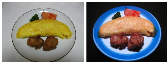
(a) “いろどりん”使用前 (b) “いろどりん”使用后