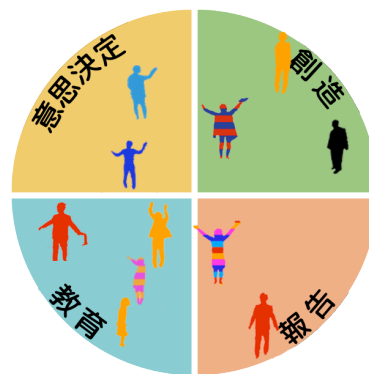
図4: プロジェクタで投影するアニメーション

シルエットの色は会議参加者の部署を表す。これも事前にiPadに入力された情報から得ている。各部署ごとに色を設定しており、単一部署のみで行われた場合は単色のシルエット、複数部署で行われた場合はその部署の色の横縞模様でシルエットを彩色している。