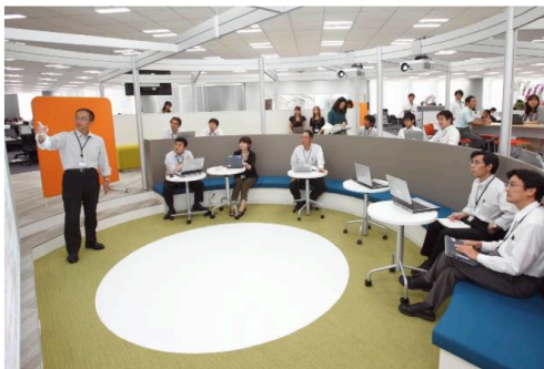
図1: 壁の無い開放型会議スペース。床中央の円形部分に人影を投影する。

筆者らは、実際の企業オフィス*に設置された開放型会議スペースに着目した。これを図1に示す。アゴラ（広場）と名付けられたこの空間は、2,000平方メートルの複数部署が所在する業務フロアの中心に設置された約20平方メートルの壁の無い会議スペースである。この場所は、事前予約なしで誰でも会議を行うことができ、フロアを移動する人たちがその様子を自由に垣間みることができる。本研究では、過去に参加した会議発表者の人影をアゴラに提示することで、この場で行われた活動にオフィスメンバーが注目することを促すシステムを提案し、設置・評価を行った。