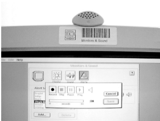
(c) ディスプレイなど周辺機器に貼って、制御パネルプログラムを起動する