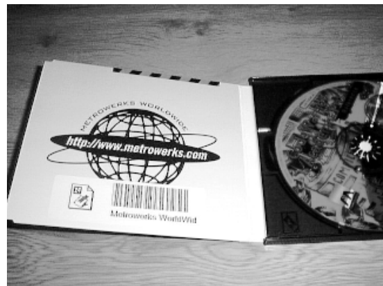
(d) 製造会社 WWW ページの URL アイコンを貼って、製品情報ページを開く