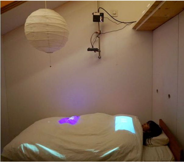
図 3: 実際に使用している場面