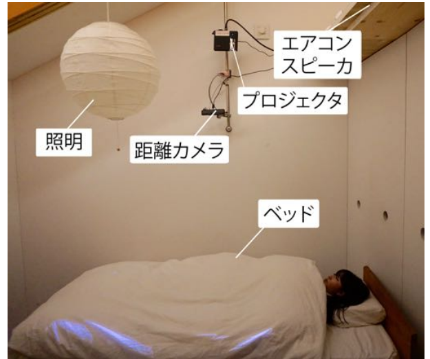
図1: システムの外観

ユーザは本システムを以下のように操作する。通常はプロジェクタは消灯しており、一方で距離カメラは