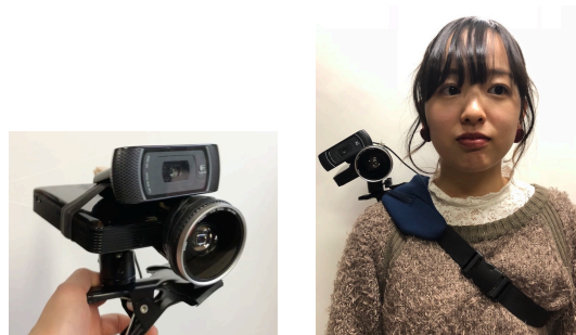
図 1: デバイス外観と装着例

今回の検証に使用するデバイスのシステム構成を図 2 に示す。本システムは、PC 2 、Web カメラ 3 、ワイド